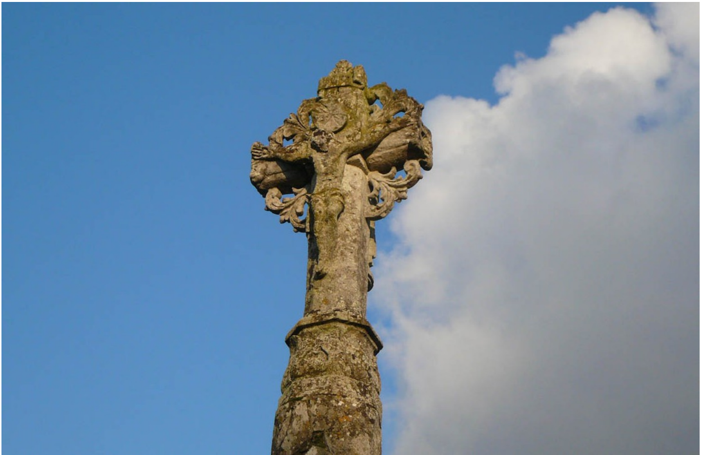
Photographie du monument historique